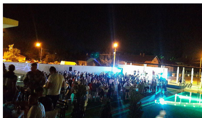
фото: Базени Славија